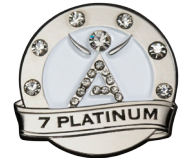
플래티넘 레벨 이그제큐티브 및 크리스탈 이그제큐티브

재등록 순위를 참조해 성공의 폭을 무한대로 늘리세요. 225 사이클을 달성하고 재응모 자격을 승인받으면 아이사제닉스의 인증 최고 직급인 플래티넘이 되십니다. 별을 추가로 더 모으는 회원에게는 성공을 기념하는 우아한 새 뱃지를 드립니다.